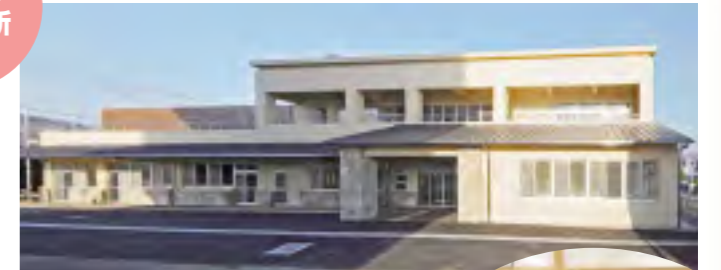
H25.4.1にオープンした幸礼コミュニティセンター（支所併設）

※市役所の支所・出張所が併設している施設もあります。住民票や市税など行政関係の手続きは支所・出張所までお問い合わせください。