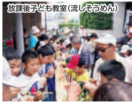
放課後子ども教室(流しそうめん)