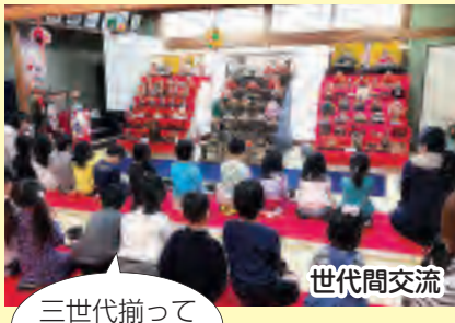
三世代揃ってひなまつり