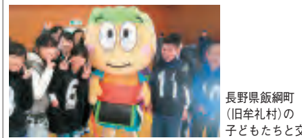
長野県飯綱町(旧牟礼村)の子どもたちと交流