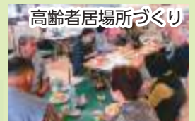
高齢者居場所づくり